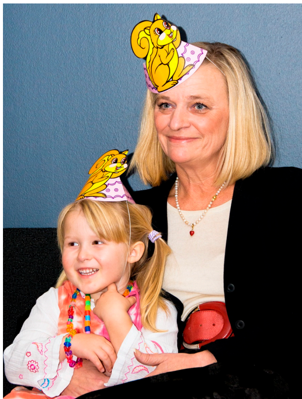
Barnkalas på institutionen 2007