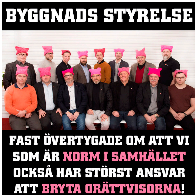
Byggnads Twitterkonto, @Byggnads 8 mars 2017.

lika lön för lika arbete och rätt till kropp och reproduktiv hälsa) (Black, 2017). I den svenska kontexten väcktes en hel del reaktioner då fackförbundet Byggnads styrelse bestående av 15 vita medelåldersmän ställde upp för en gruppbild iförd hemmagjorda pussyhats för att solidariskt uppmärksamma internationella kvinnodagen. De fick en del positiva kommentarer men de fick också en hel del kritik, dels för att det inte fanns några kvinnor representerade i styrelsen, dels för att de ansågs förlöjliga och göra narr av kvinnor snarare än stödja dem.