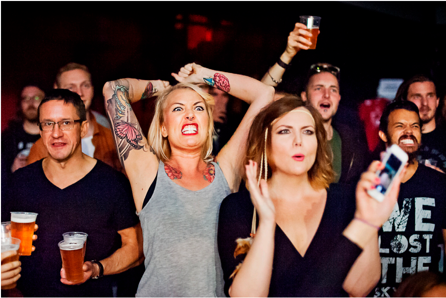
Upprörd wrestlingåskådare (GBG Wrestling, Trädgår'n i Göteborg).

Som karaktärsrestler kan man således få ökat utrymme för sitt skådespeleri i en lugnare församling, medan andra brottartyper är beroende av mer turbulens i lokalen.