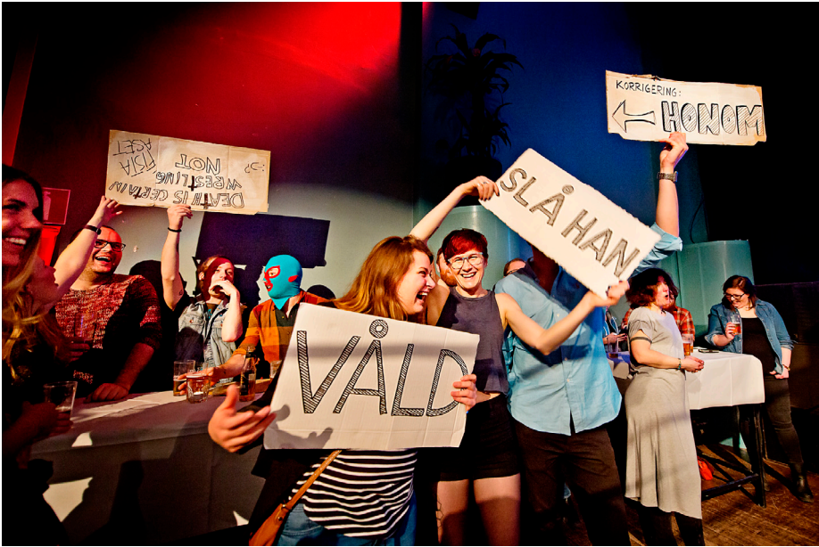
Publiken med skyltar.