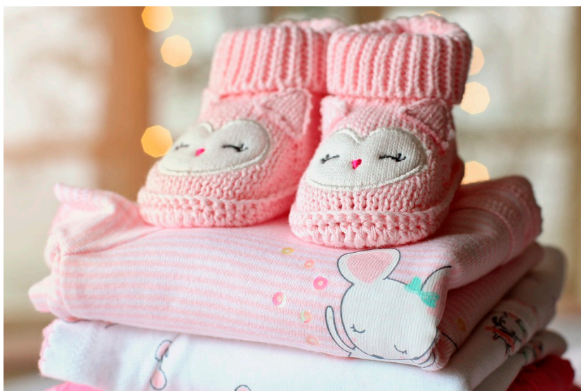
Genuskodade babykläder är legio sedan 1970-talet.

I boken analyseras färgens symbolik och betydelse genom olika epoker. Den rosa färgens koppling till unga flickor och konsumtionskultur växte sig stark först under 1970–80-talet. Rosa var i tidernas begynnelse i lika stor utsträckning en färg för män som kvinnor. Den bär på associationer till makt, mod, stolthet liksom erotisk skönhet, naken hud, könsorgan och barnslig fåfänga. Det var inte minst det senare som ansågs riskera att trivialisera kvinnors protester mot Trump-administrationen under den så kallade Women’s March, 2017 i Washington.