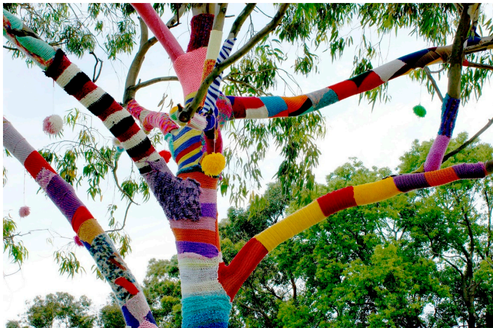
Craftivism t.ex gerilla-stickning utgör ofta ett färgstarkt inslag i det offentliga rummet

kan betraktas som ett medium och bärare av symboliska budskap. Den som utför arbetet (the maker eller the crafter) kallar Garber (2013) för mänsklig mikrofon. Att ägna sig åt dessa kreativa praktiker är ett sätt att göra sig hörd, uttrycka åsikter, ibland också protestera och involvera andra, åtminstone försöka påverka för att uppnå social eller politisk förändring, och oftast utifrån en feministisk agenda.