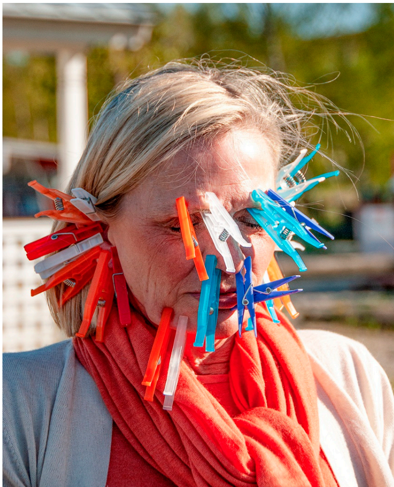
Som lektedare under personaldagarna i Vitemölla 2007

Även de många av institutionens personalkonferenser och institutionsdagar som arrangerades av Gunilla var alltid välplanerade ifråga om såväl det som rörde arbetet som de kulinariska och sociala kvällsaktiviteterna, som mycket väl kunde anta barnkalasliknande former med Gunilla som entusiastisk lektedare.